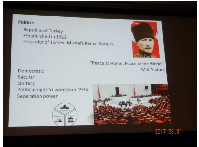
共和国父アタチュルクは三権分立、早い女性参政権を確立