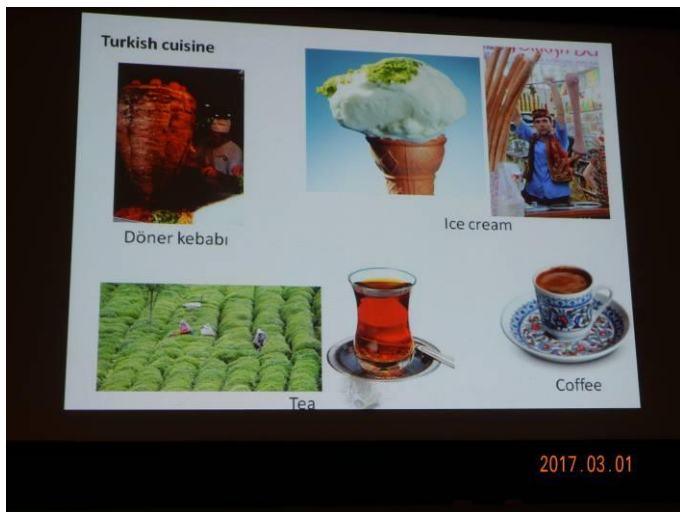
代表的な食べ物ケバブ、アイスクリーム、茶畑と茶、コーヒー