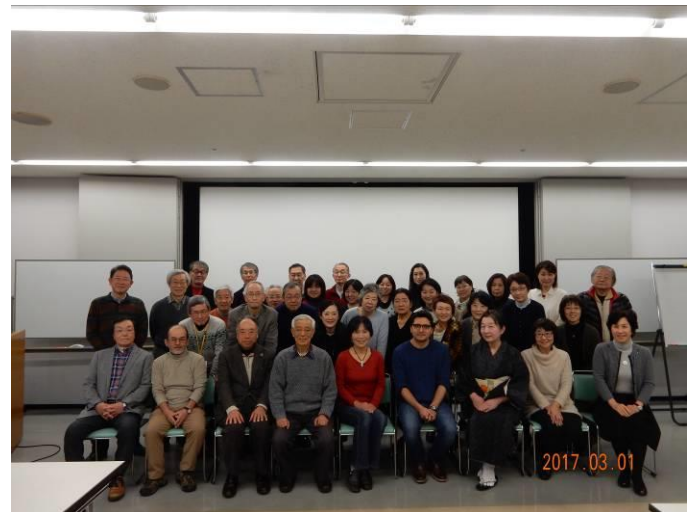
36人が参加しての記念写真