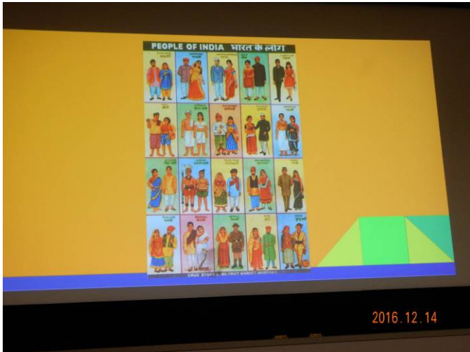
民族衣装から多民族、多宗教の国を紹介