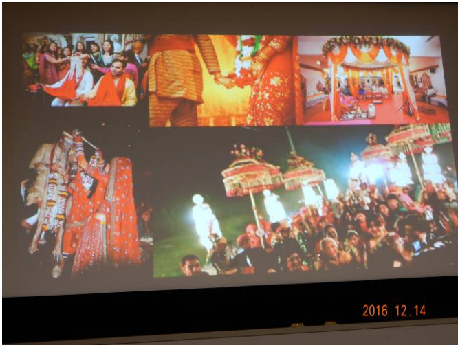
華やかな結婚式、音楽・ダンス中心の映画が楽しませてくれる