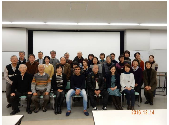
30人が参加しての記念写真