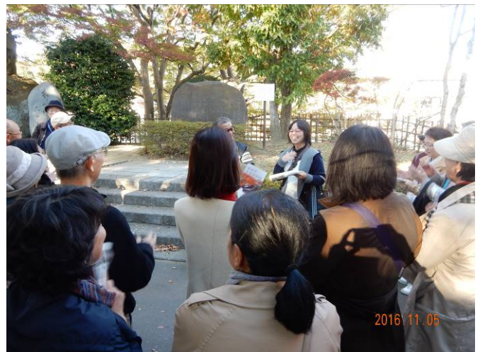
観瀾亭裏庭にある「どんぐりコロコロ」碑前で唱和