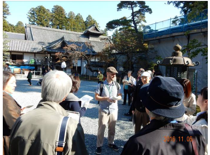
瑞巖寺平成の大修理を終えた本堂前でのガイド練習