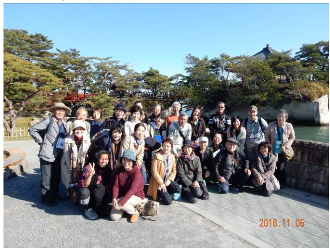
松島のシンボル五大堂をバックに記念写真