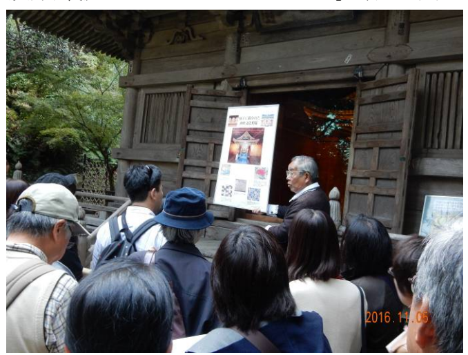
円通院三慧殿では地元ガイドの説明を聞く