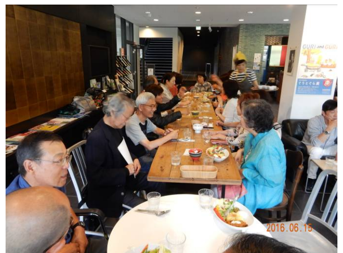
ランチを近くの萩ホールレストランで歓談