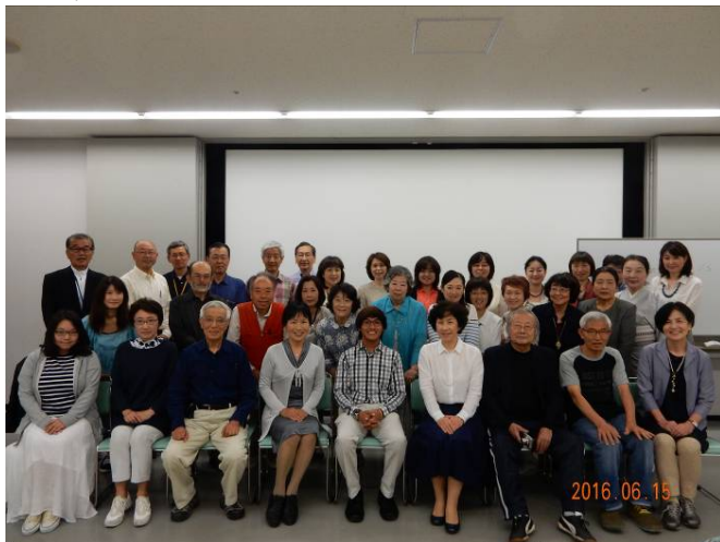
35 名が参加しての記念写真