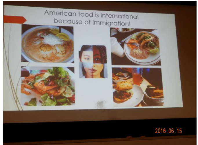
移住者の国である米国料理の多様さ