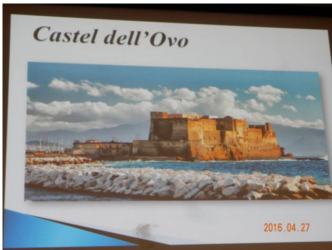
紀元前1Cに建設されたナポリ最古の城