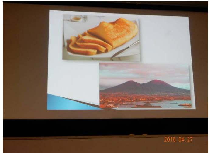
ヴェスヴィオ火山の山容のスイーツは人気