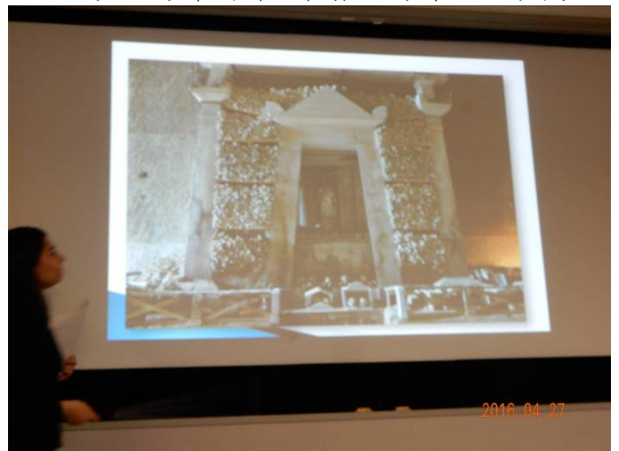
教会には死者の骸骨が並べられている