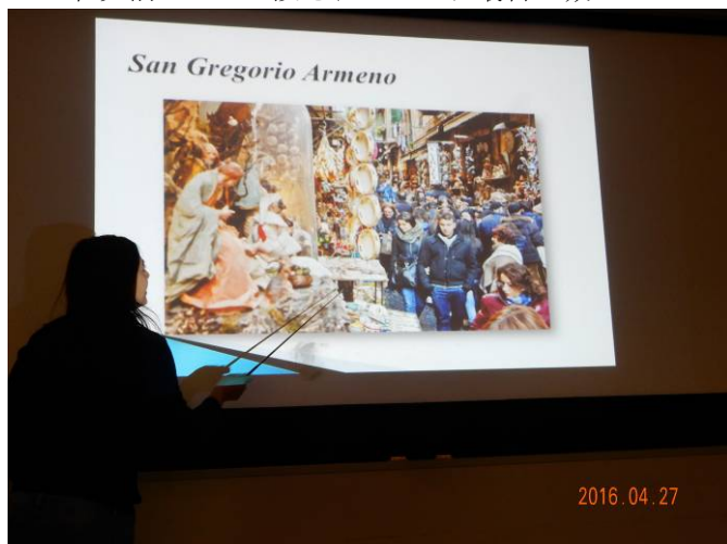
カソリック最大のお祭りクリスマスの賑わい