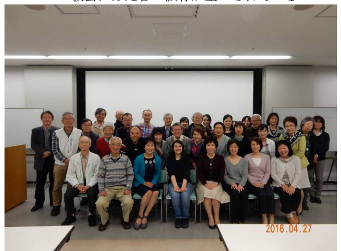
35人が参加しての記念写真