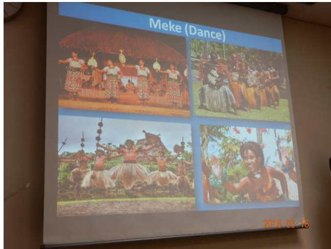
フィジーは高温多雨の熱帯で観光、農業が主な産業。主に水力発電で全国の電力を供給している。