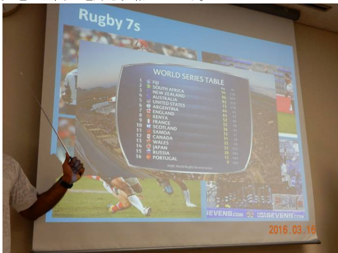
ラグビーが最大人気のスポーツで、国際ランキングは1位。