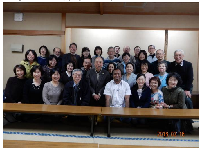
会場の戦災復興記念館和室での記念写真。