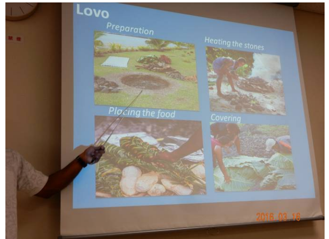
主食はイモ類で、材料を葉で覆い、加熱した石で蒸し焼きをする。デンプン質が多いため、どうしても太り気味になる。