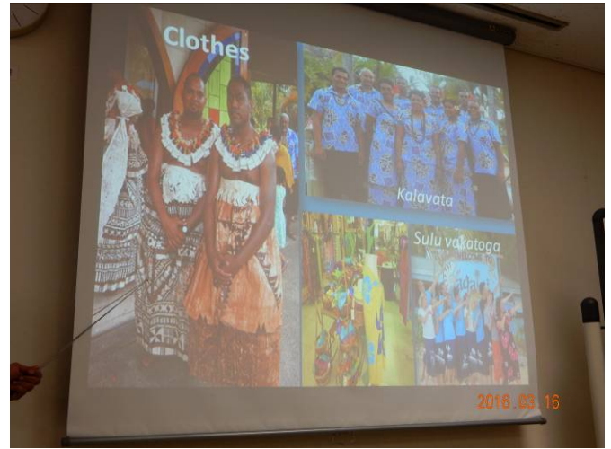
民族衣装は組織ごとに色・デザインが統一されている。