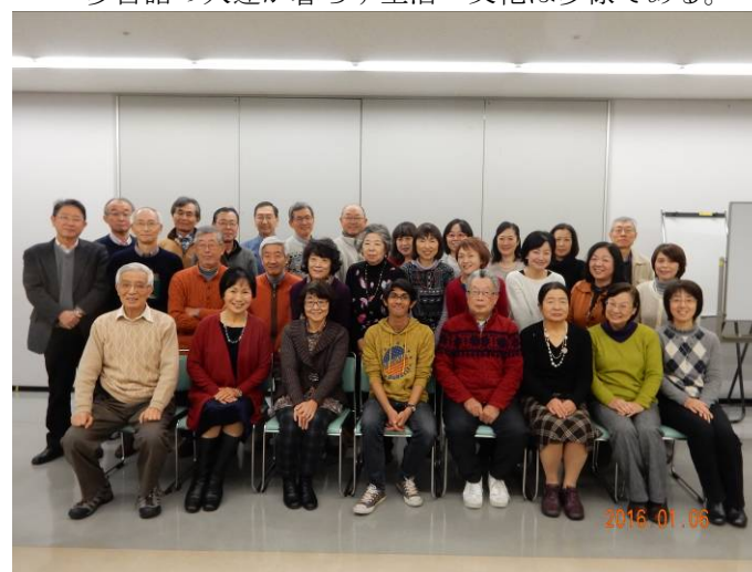
31人が参加しての記念写真