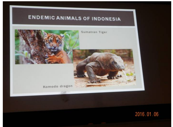
スマトラ・トラ、コモドドラゴンに代表される貴重な動植物が多く、種類はブラジル(アマゾン)に次いで世界2位である。