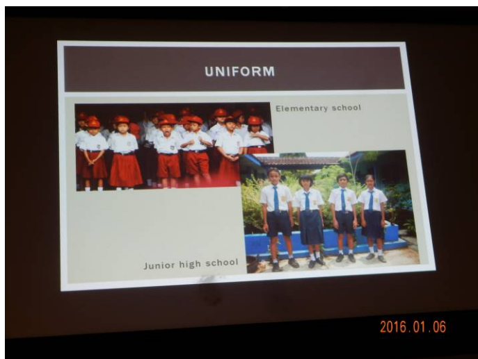
6・3・3の小中高制度で制服もまばゆく生き生きしている。