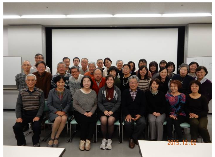
34人が参加しての記念写真