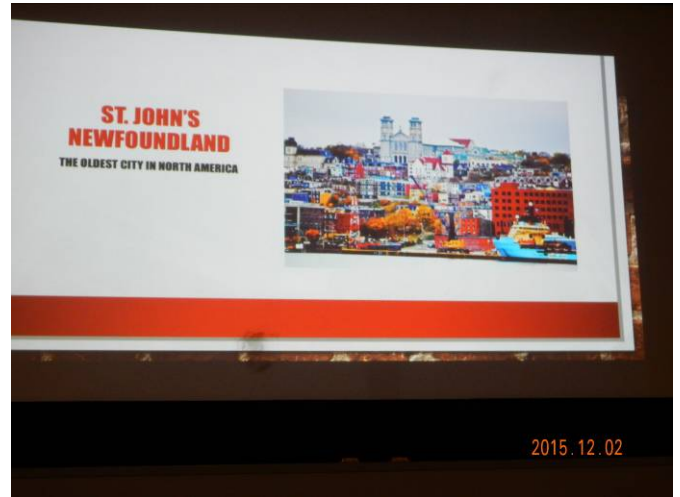
ニューファンドランドはコロンブス以前に欧州人(北欧)が最初に到達し、又近代では欧州との最初の無線交信地です