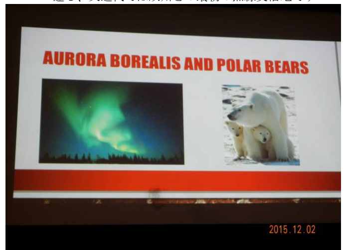
カナダの南西部(バンクーバー付近)を除いた大半は、北極に近いことでオーロラや北極熊の世界です。