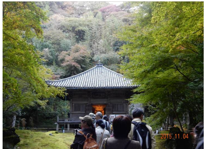
紅葉した円通院では禅の石庭、踏み石、池やバラ園を見る