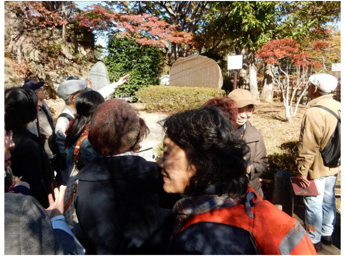
観瀾亭では「どんぐりコロコロ」の碑前で英語で唱和