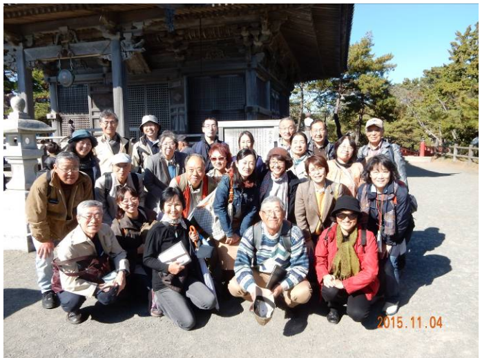
外国人観光客も多い中、五大堂前での記念写真