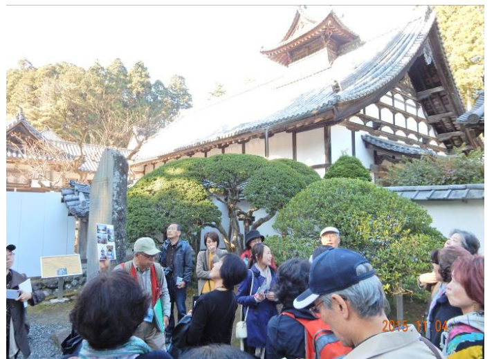
公開中の国宝庫裏で、仮置き政宗公位牌等を近くで見る。