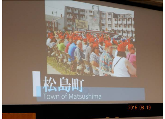
東海岸名物メインロブスター、イベントと調理法を紹介