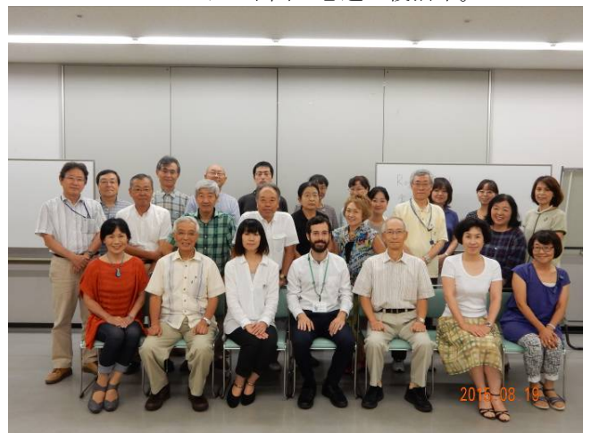
25人が参加しての記念写真