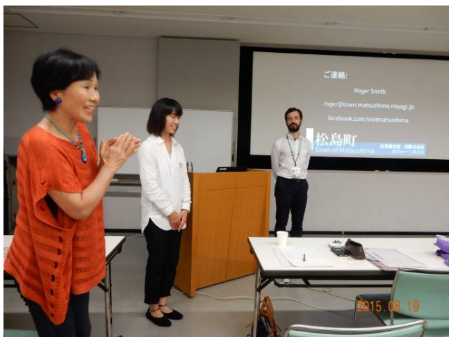
講演を終え、松島町のお二人に御礼の拍手をおくる。