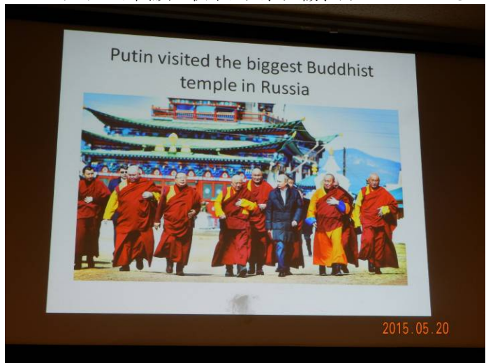
国内には最大の仏教寺院があり、プーチン大統領も訪問