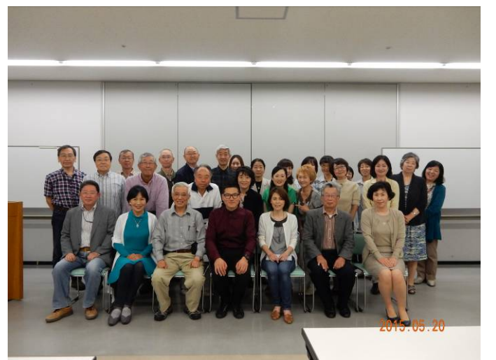
30人が参加しての記念写真