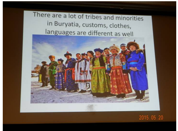
ほぼ日本と同じ面積に仙台の人口数が住む多民族国家です