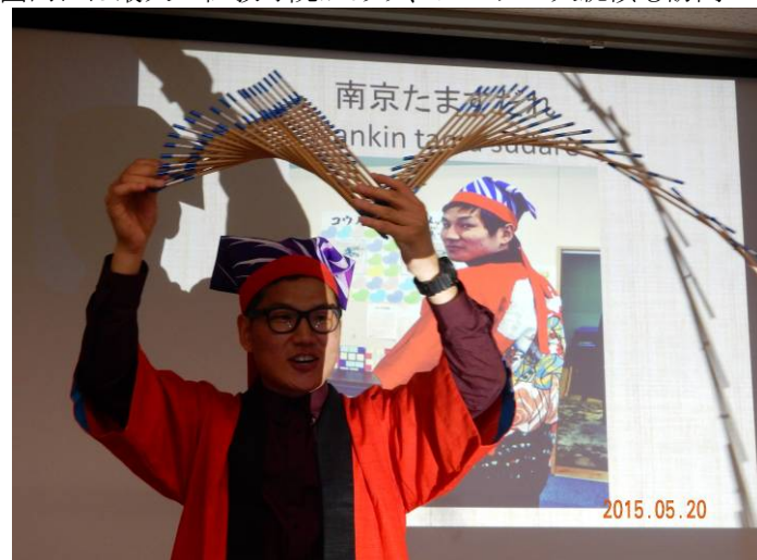
日本で覚えた南京玉すだれはモスクワの異文化紹介で1位