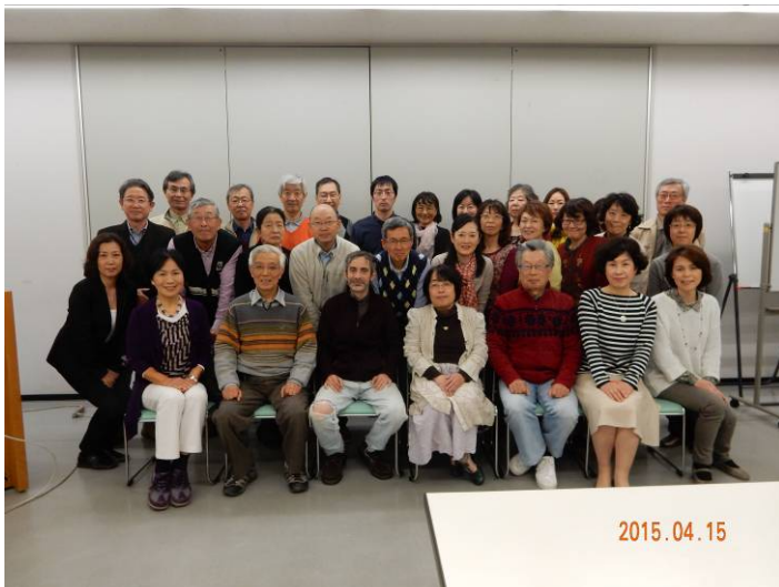
31 人が参加しての交流会は盛況でした。