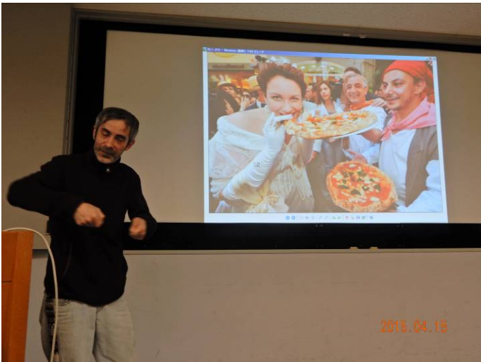
このピザは一人分の大きさで、日本人の 5 人分になる