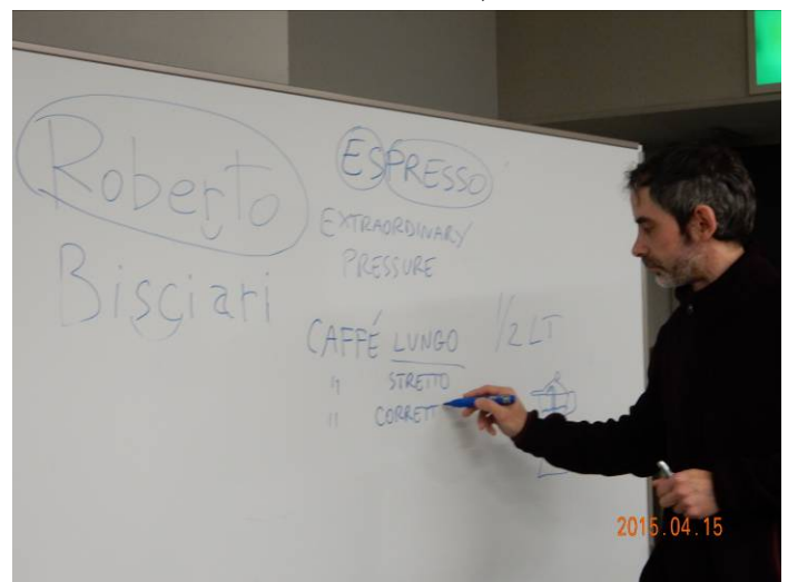
コーヒーの歴史・文化について語源を含め説明。