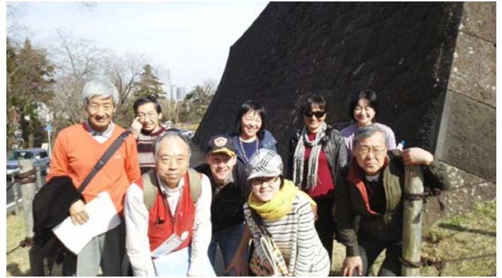
日本一美しいといわれる本丸北面の石垣。 一万個の三滝安山岩。