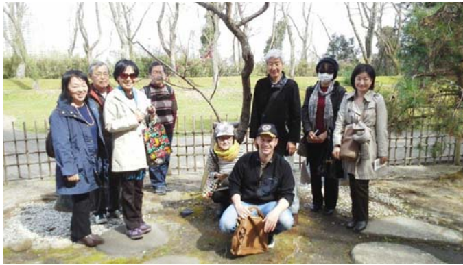
三の丸の紅梅を囲んで。博物館のお庭から、いざお城へ。

(CG 復元) の出典 : http://honmarukaikan.com/top.htm