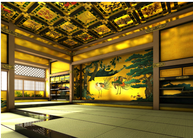
最高絵師による本丸大広間の日本画 (鳳凰) (CG 復元)。 上段の間 (主君) と奥の上々段の間 (天皇・将軍)。