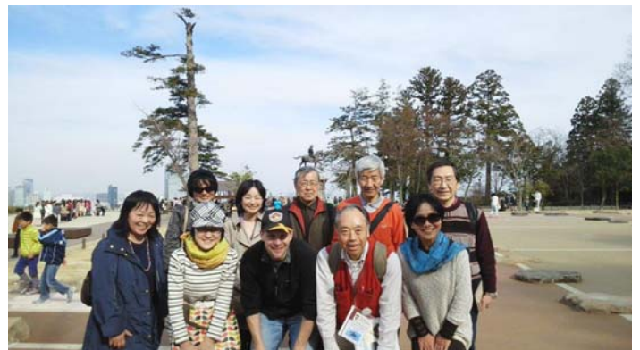
UNWCRR を機に再現された、本丸大広間の基礎に立ち、当時の政宗を思い浮かべながら、“ずんだもち”。