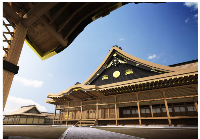
本丸大広間、賓客をもてなす豪華な本丸の中心 (CG 復元)。