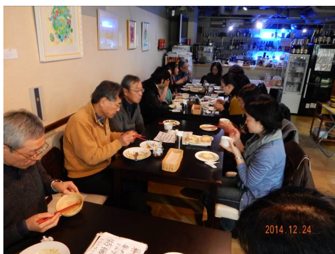
今年最後の昼食会では、忘年会不参加者の報告もあり盛況でした。