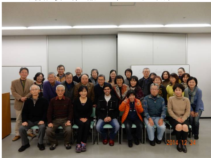
28人が参加した交流会。