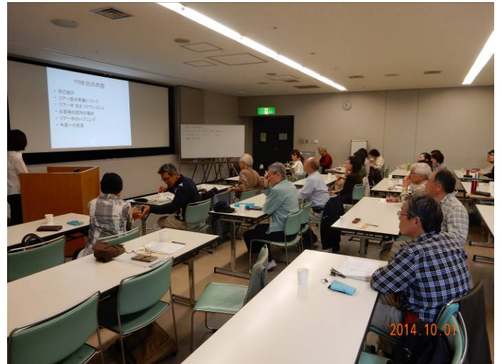
30名のメンバーが参加し、質疑応答も熱心でした