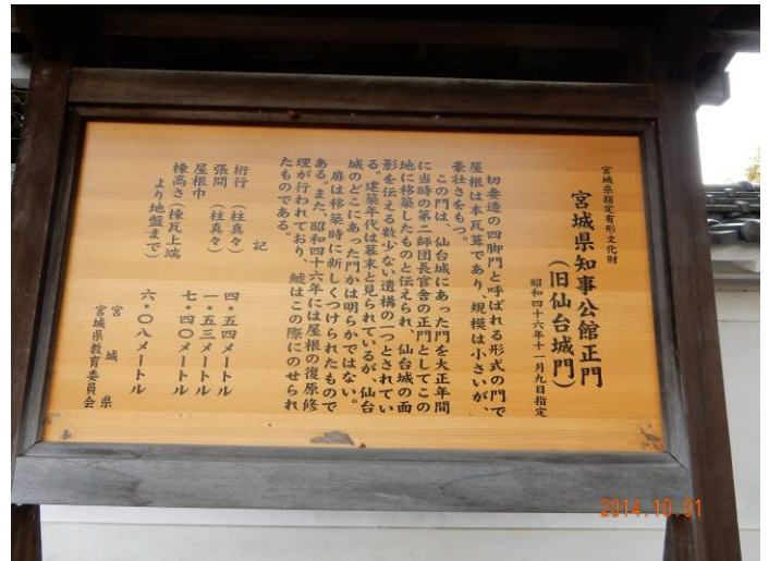
宮城県知事公舎門は由緒ある仙臺城門の一つです