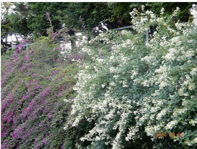
仙台の象徴「宮城野ハギ」は美しい季節：知事公舎の赤白萩