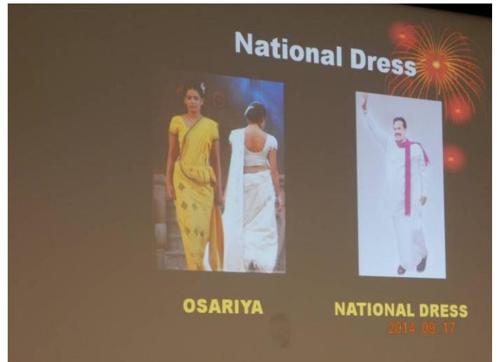
カラフルな民族衣装