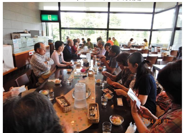
三の丸で昼食会も20人が参加