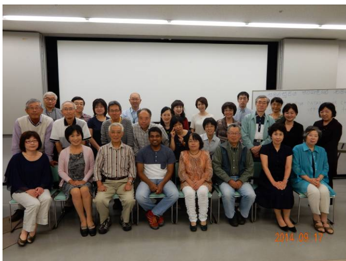
29人が参加した交流会は盛況でした