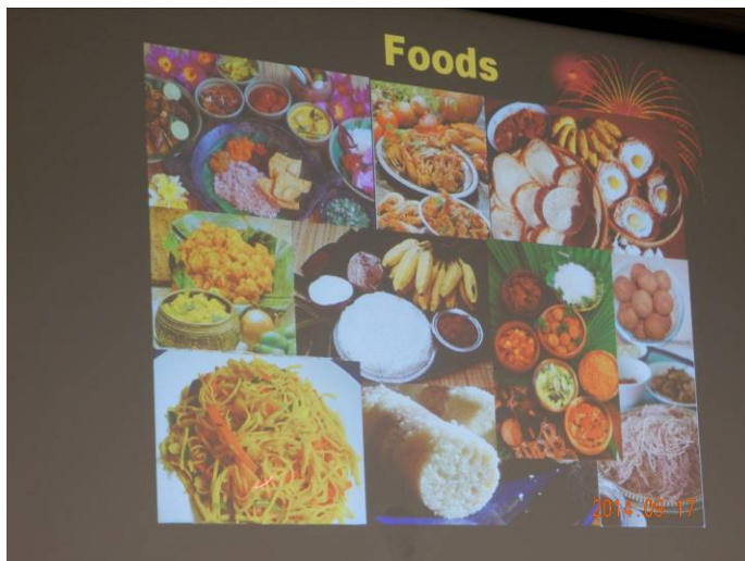
豊富な食材からの伝統料理。