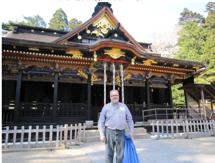
大崎八幡宮での記念写真