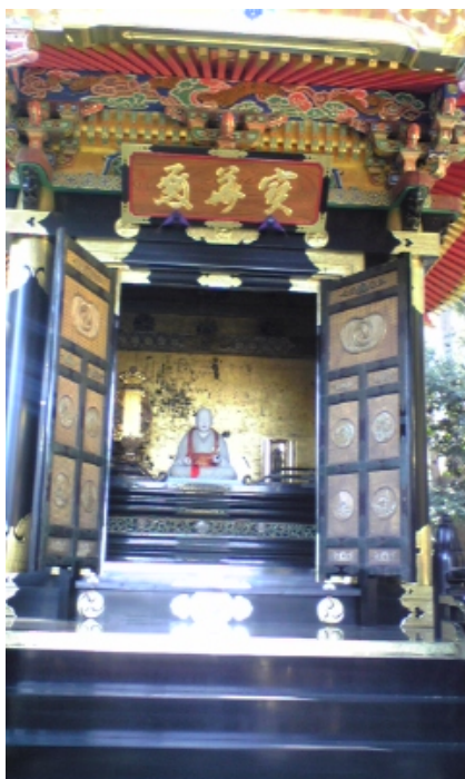
幸運にも寶華殿が公開されていました