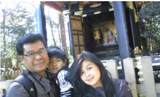
陽徳院御霊屋(寶華殿)前で廟へ

瑞巖寺ではまっすぐに伸びた杉木立のすばらしさ、モクレンの花、梅の花等自然の美しさに心がひかれたようです。「子育て地蔵」では子供に健康と知恵と礼儀正しさを授けてくれることを伝え、陽徳院と霊廟をご案内しました。御霊屋では、たまたま公開されていたことで内部を見ることが出来ました。