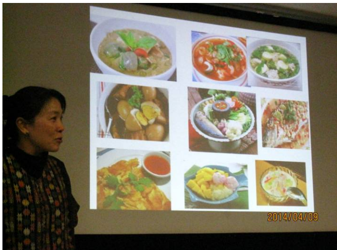
野菜・魚の豊富な材料、色彩豊かなタイ料理