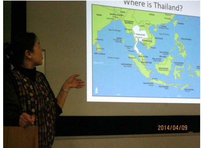
タイの形は象に似ていて、象との関係が深いことが分かる