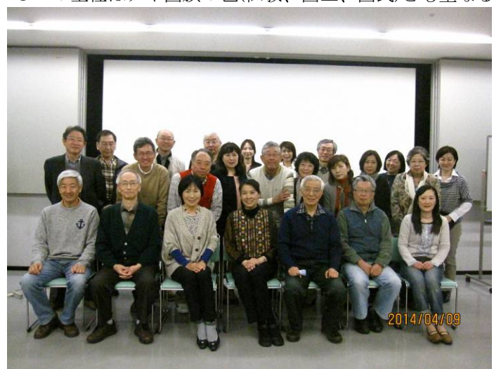
25人が参加しでの笑顔での記念写真