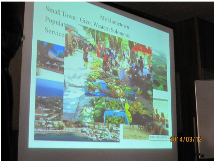
故郷の市場：タロイモが主食でトロピカル果物が多い