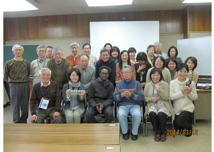
26人が参加しての笑顔での記念写真