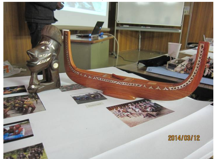
人形、カヌーの置物と奥にはシェルマネーを披露