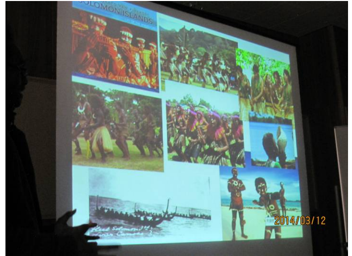
島での生活では5才位からカヌー乗りを始める